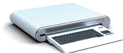
Fot. 1. Klawiatura z dezynfekcją UV

W większości urządzeń medycznych elementami sterującymi elektroniką są klawiatury. Mogą to być klawiatury mechaniczne (np. komputerowe), silikonowe lub foliowe. Utrzymanie w czystości klawiatur mechanicznych, z racji ich skomplikowanej konstrukcji, jest bardzo trudne. Wymagają długotrwałego żmudnego czyszczenia ręcznego lub stosowania automatycznych systemów myjących, drogich i nieefektywnych.