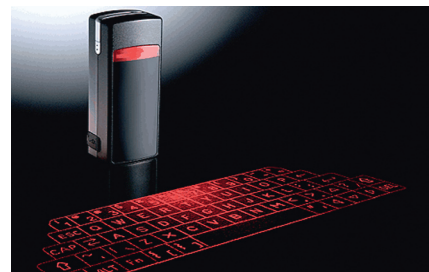
Fot. 4. Wirtualna klawiatura laserowa

Ciągłe dążenie do doskonalenia nowych produktów, usprawniania ich obsługi i konserwacji powoduje poszukiwanie nowych rozwiązań technicznych. Jedną z takich propozycji jest próba skonstruowania takiej klawiatury, która nie