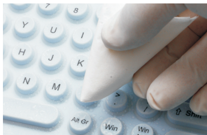
Fot. 2. Klawiatura silikonowa

Łatwiejsze w utrzymaniu czystości są klawiatury silikonowe lub mechaniczne pokryte warstwą silikonu. Silikon tworzy powierzchnię hydrofobową, łatwą w myciu, a jednocześnie odporną na narażenia chemiczne.